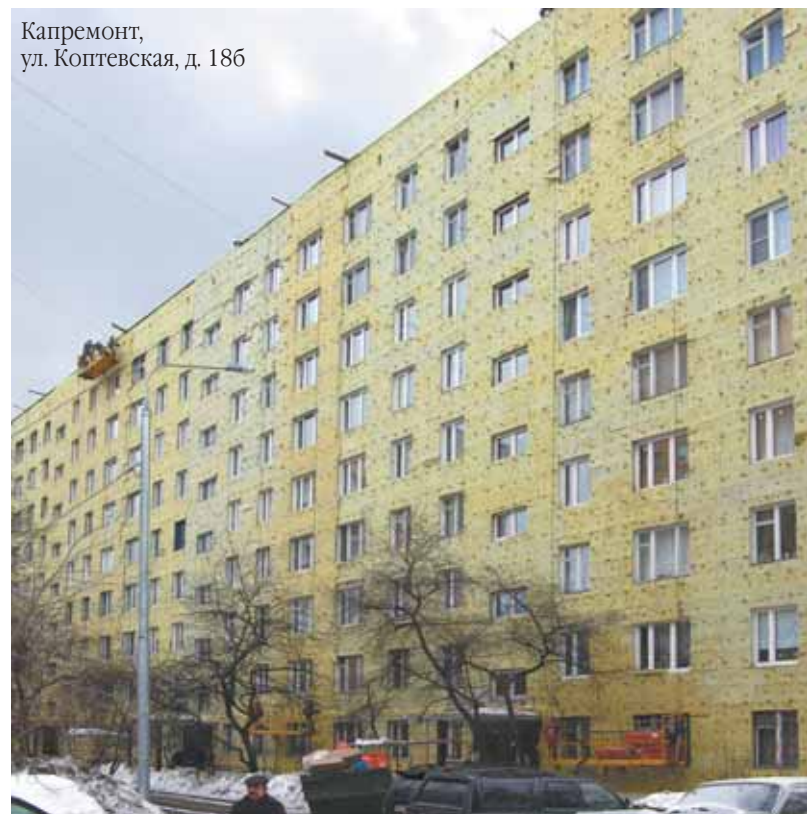
Капремонт, ул. Коптевская, д. 186

рованного Генерального плана города Москвы на период до 2025 года. Размещение жилищного строительства на территории морально устаревшего пятиэтажного фонда по программе реновации территории сложившейся застройки в кварталах 16 и 17 планируется в 2013—2015 годах, а в других выше перечисленных кварталах — задел последующих лет.