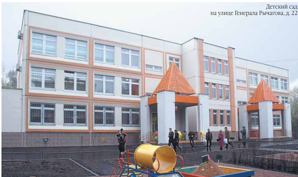
Детский сад на улице Генерала Рычагова, д. 22

В квартале 119 ведутся работы по реконструкции и строительству дороги от проезда Черепановых длиной до Октябрьской железной дороги и двух проездов от Большой Академической улицы до проезда Черепановых. Все работы должны быть закончены в 2010 году.