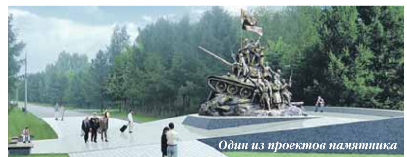
Один из проектов памятника

Москомархитектура с 5 апреля по 25 мая 2010 года провела открытый конкурс на памятник «В борьбе против фашизма мы были вместе», символизирующий неприкосновенность монументов воинам, павшим в Великой Отечественной войне. Из 25 представленных на конкурс проектов экспертной группой